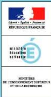
Schéma d'emplois 2011 - 2013